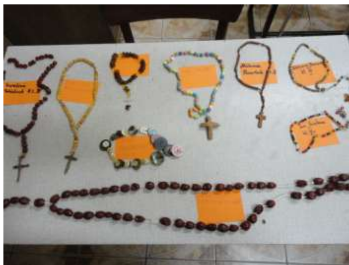
Różańce wykonane przez naszych uczniów

Zdrowaś Maryjo, łaskiś pełna, Pan z Tobą. Błogosławionaś Ty między niewiastami i błogosławiony Owoc żywota Twojego Jezus. Święta Maryjo, Matko Boża, módl się za nami grzesznymi, teraz i w godzinę śmierci naszej. Amen.