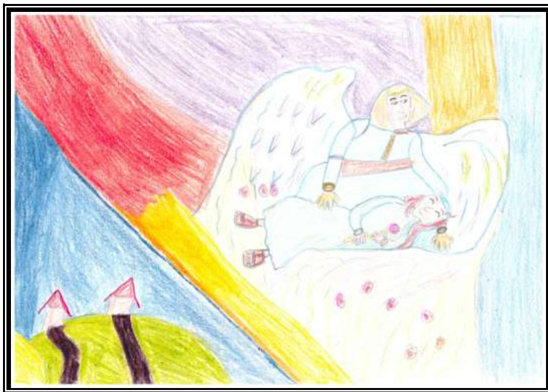
Wniebowzięcie Najświętszej Maryi Panny – rys. Krystian Filipiński