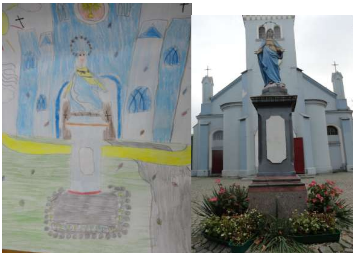
Rys. Ola Ściebura – Figura Św. Maryi Przed Kościołem w Łodzi