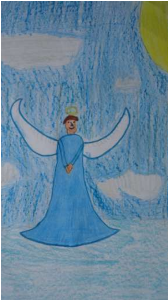
Rys. Sebastian Stelmach

Ewangelia mówi o ukazaniu się anioła św. Józefowi, który nakazuje mu ucieczkę do Egiptu wraz z Maryją i Dzieckiem, a po śmierci Heroda - powrót do Nazaretu.