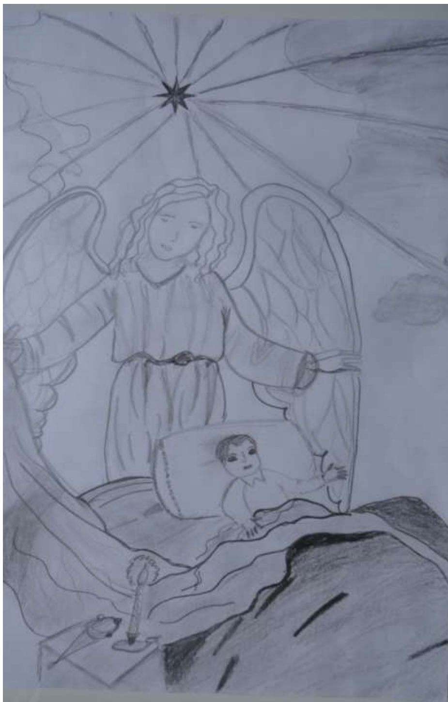
Anioł Stróż - rys. Julia Stolarz