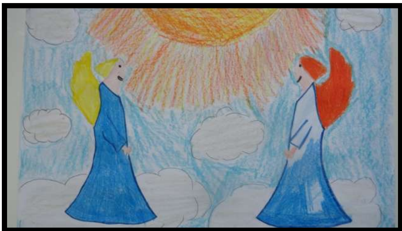
Rys. Ola Ściebura kl. IV SzP