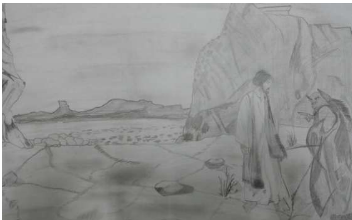
„Kuszenie Pana Jezusa na pustyni” rys. Adam Błaszczak