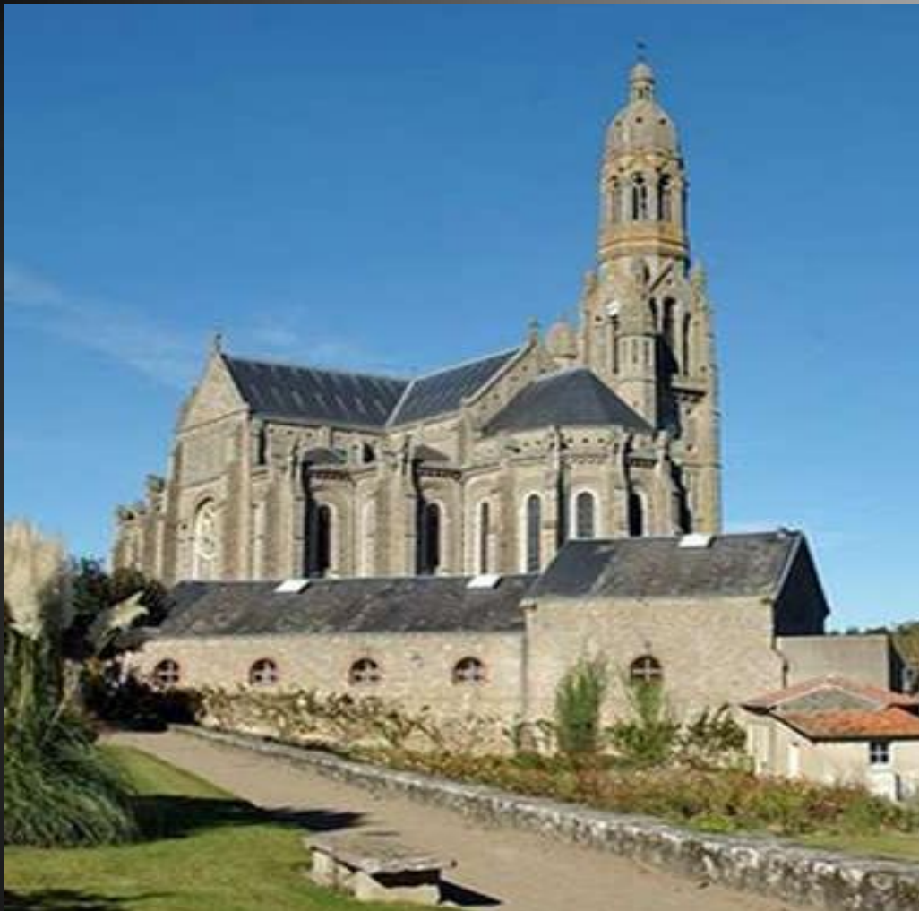
Bazylika p.w. św. Ludwika Marii Grignon de Montfort w Saint- Laurent- sur-Sevre