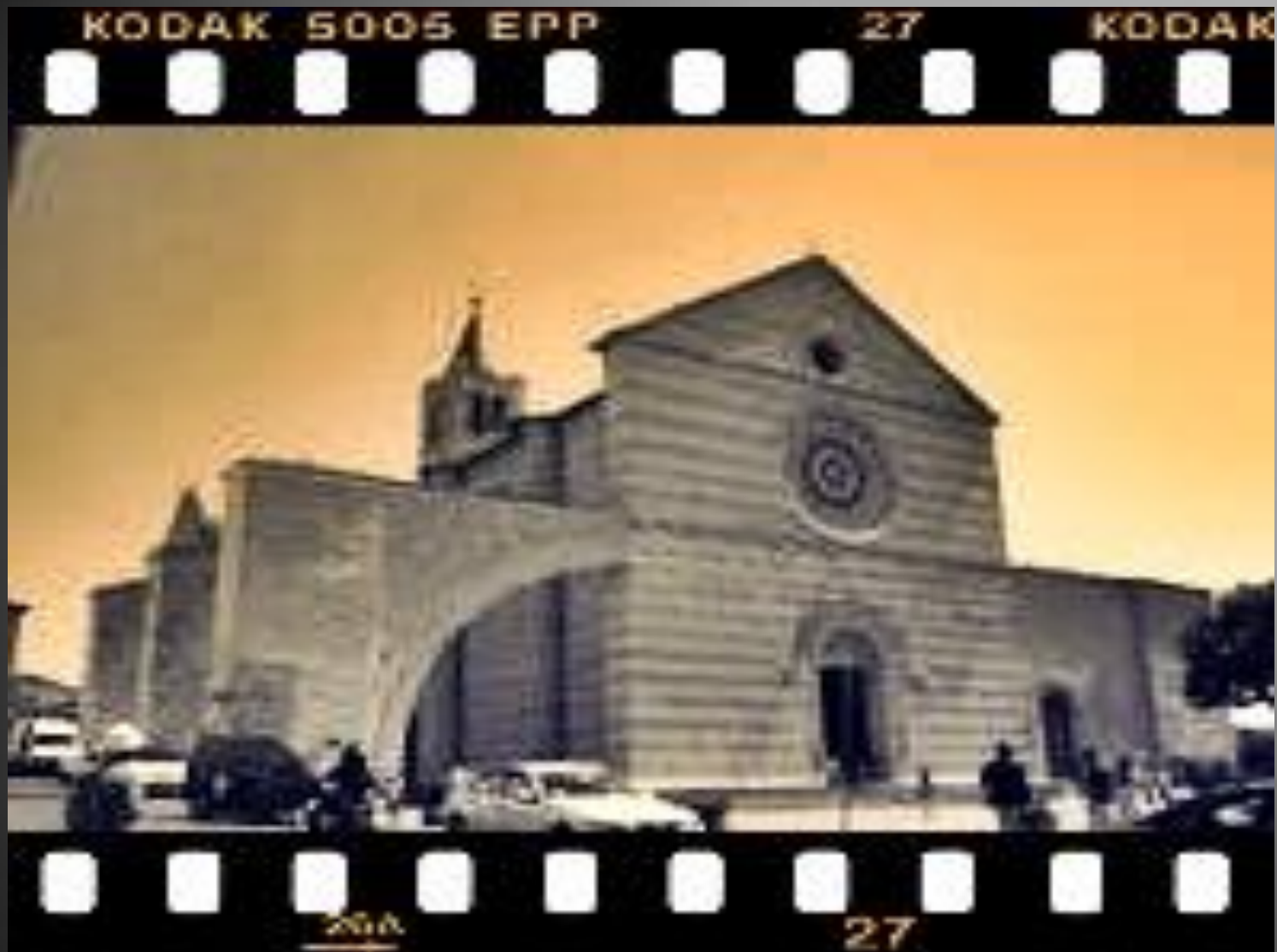
Bazylika Św. Klary w Asyżu